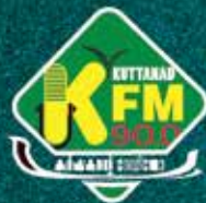
Kuttanad FM 90.0 7.00 am to 9.00 am Daily