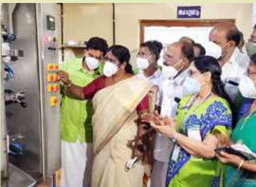
Dairy plant Inauguration at Ancharakkandy, Kannur