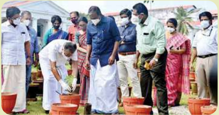
Onathinu Orumuram Pachakkari Inauguration