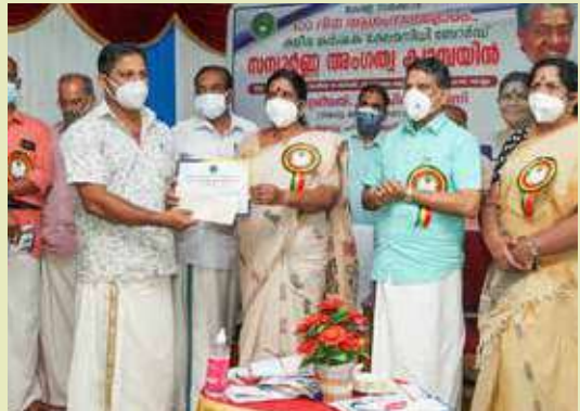
Kerala Dairy Farmers Welfare Fund Membership Campaign Inauguration at Chadayamangalam