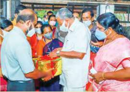
Inauguration of Foot and Mouth Disease Vaccination under National Animal Disease control program II Phase