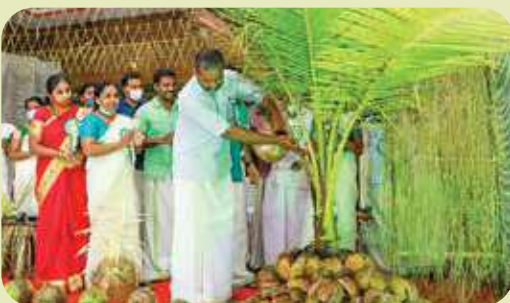
Keragramam Inauguration at Kanjikkuzhi, Alappuzha