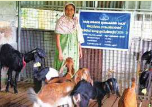
RKI Goat rearing scheme