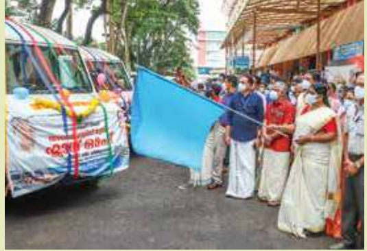
Inauguration of Ambulatory service in Animal Husbandry Department