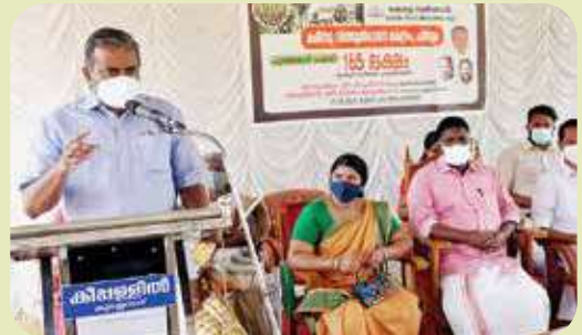
Punarjani at Pandalam Farm