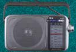
Farm News All India Radio 7.05 AM Daily