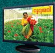
Noorumeni Video Documentary Doordarsan (Mal) Sunday 9.30 AM Kairali News Channel (Mal) Sunday 3.30 PM