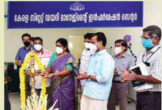
Kerala State Dairy Management Centre Inauguration