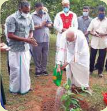
One crore fruit plant Inauguration