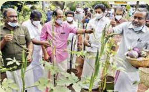
Onathinu Orumuram Pachakkari Harvest