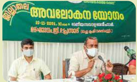
District level Avalokana Yogam